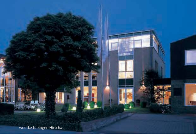
wodtke Tübingen Hirschau

Wenn Sie mehr wissen wollen – zur wodtke Pellet Primärofen®-Technik »Die Zukunftswärme«, oder zu wodtke Kaminöfen »Feuer in Form« – fordern Sie unsere Gesamtkataloge an. Oder besuchen Sie uns direkt in unserem Feuerforum® in Tübingen, und genießen Sie einen Rundgang durch unsere Produktwelt.